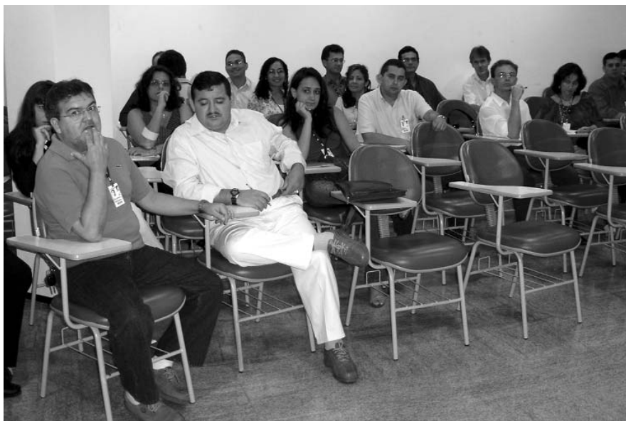
Curso de Capacitação para Servidores do TRT 21: Atividades em Natal e Mossoró

Em Natal, a ESMAT 21 está concluindo o curso de Pós-Graduação em Administração Judiciária, também em parceria com a UnP.