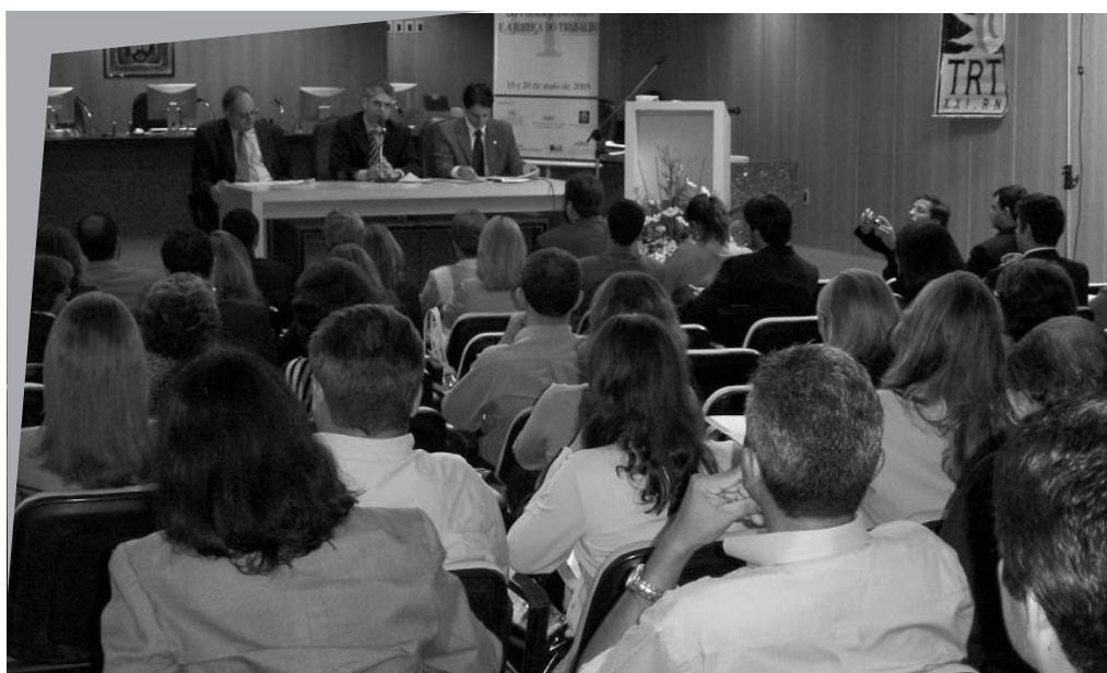
Seminário "A Reforma do Poder Judiciário e a Justiça do Trabalho" reuniu representantes das diversas carreiras jurídicas em Natal.

O Seminário "A Reforma do Poder Judiciário e a Justiça do Trabalho", promovido pela ação conjunta da AMATRA 21 - Associação dos Magistrados do Trabalho da 21ª Região, da ESMAT 21 - Escola da Magistratura Trabalhista da 21ª Região, da ABRAT - Associação Brasileira dos Advogados Trabalhistas, da PRT 21 - Procuradoria Regional do Trabalho da 21ª Região e da ANPT - Associação Nacional dos Procuradores do Trabalho, com o apoio institucional do TRT 21 - Tribunal Regional do Trabalho da 21ª Região - reuniu, nos dias 19 e 20 de maio, Juízes e Procuradores do Trabalho, servidores da Justiça e advogados para discutir temas importantes e atuais, como as novas competências da Justiça do Trabalho, os aspectos materiais e processuais da Justiça Trabalhista e a Reforma Sindical. O evento ocorreu no Plenário do TRT.