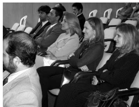
Membros da diretoria da AMATRA 21 participam das discussões sobre a EC 45.