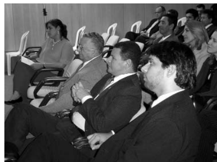
Os palestrantes abordaram temas atuais e polêmicos implementados pela EC 45.