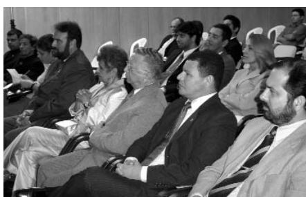
Diversas autoridades prestigiaram a abertura do Seminário.