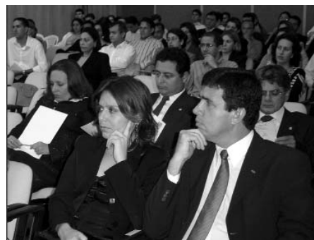
Participantes lotaram o auditório do TRT 21 para participar do evento.

As palestras serão exibidas pela TV Justiça.